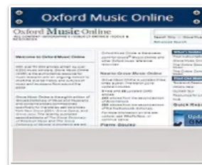
Oxford Music Online

MGGと並ぶ音楽大辞典「ニューグロー ープ世界音楽大辞典」第2版(英 語)を含むデータベース。