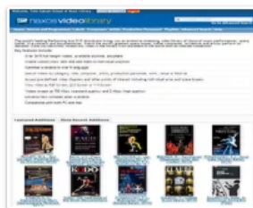
ナクソスビデオライブラリー