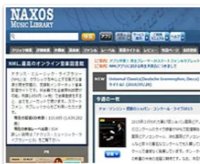
ナクソスマジックライブラリー

☆★音楽関連データベースの無料トライアルを実施中です☆★ 詳細は自宅での学習・研究のためにページをご参照ください！